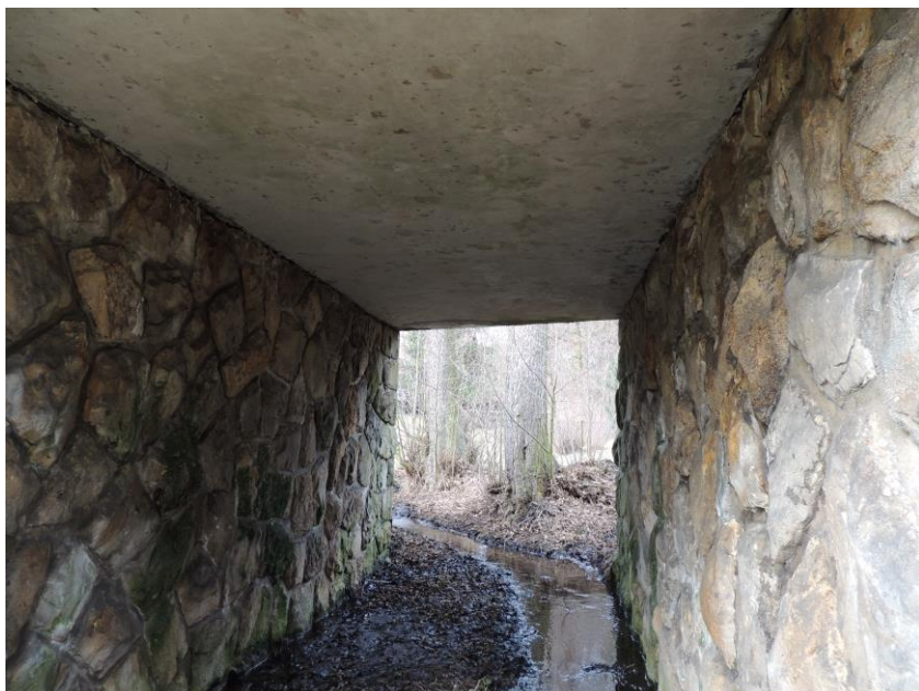
pohled na podhled nosné konstrukce