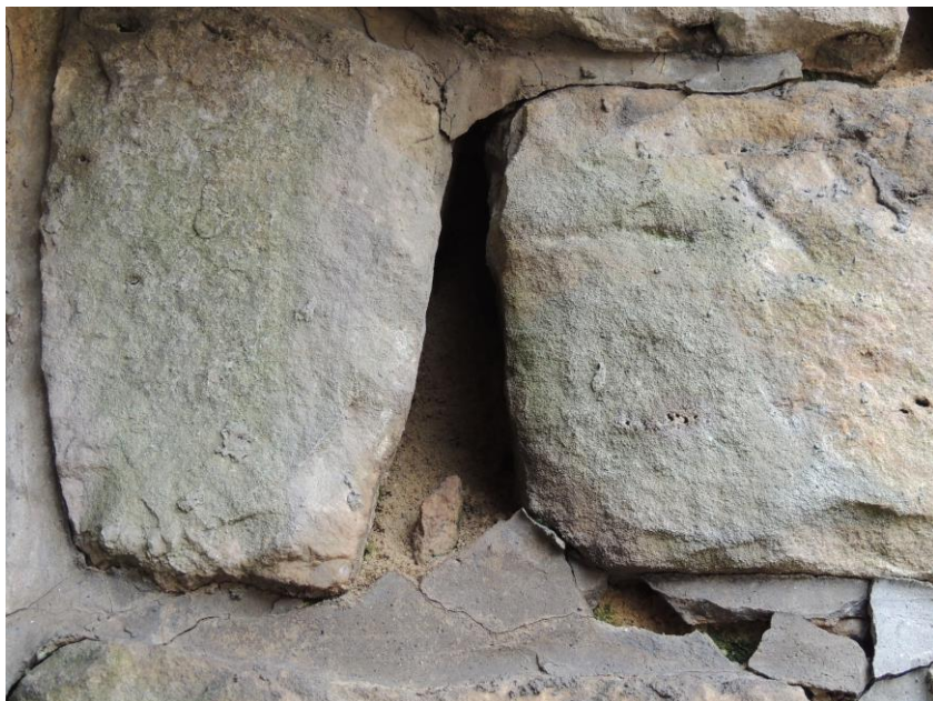
popraskaná a vydrolená styková malta na levé opěře