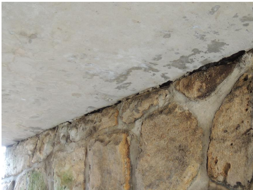
Trhliny v podhledu nosné konstrukce od korodující výztuže a uložení nosné konstrukce na pravou opěru se separací uložení asfaltovou izolací