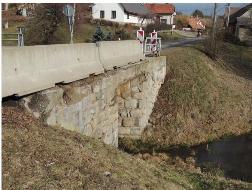
pohled na výtokovou část mostu