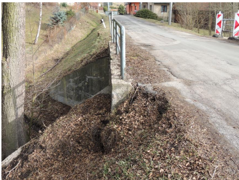
pohled na vtokovou část mostu