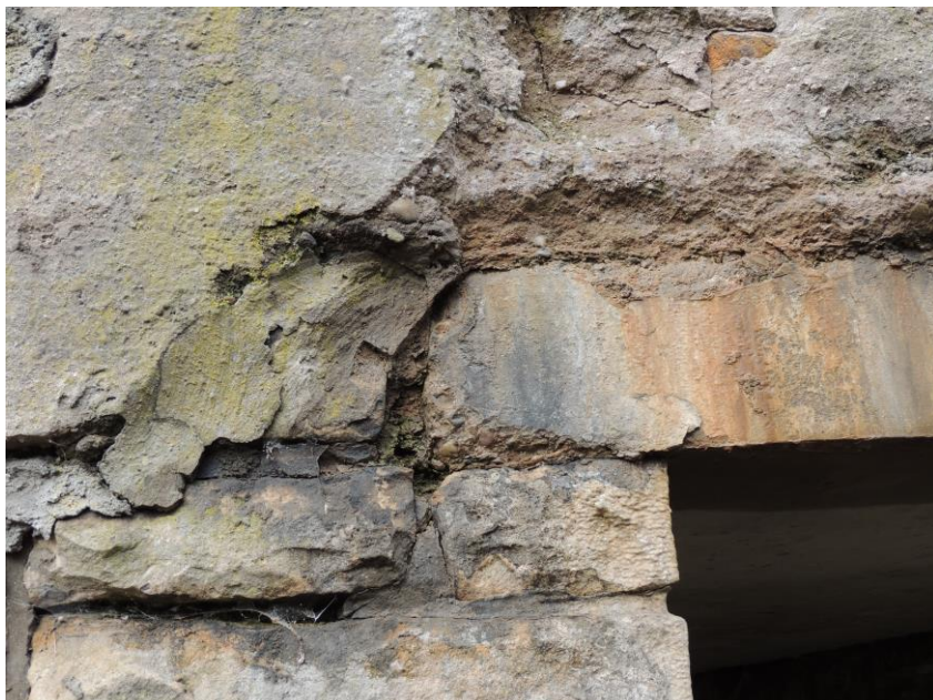
pohled na uložení nosné konstrukce na pravou opěru – výtoková část