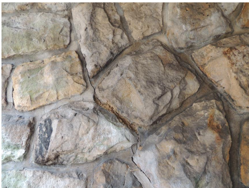
popraskaná a vydrolená styková malta na levé opěře