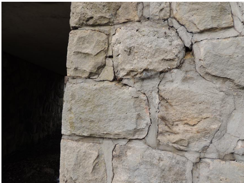
popraskaná a vydrolená styková malta na levé opěře