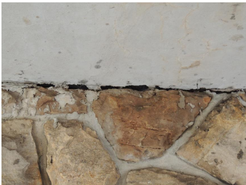
Trhliny v podhledu nosné konstrukce od korodující výztuže a uložení nosné konstrukce na levou opěru se separací uložení asfaltovou izolací