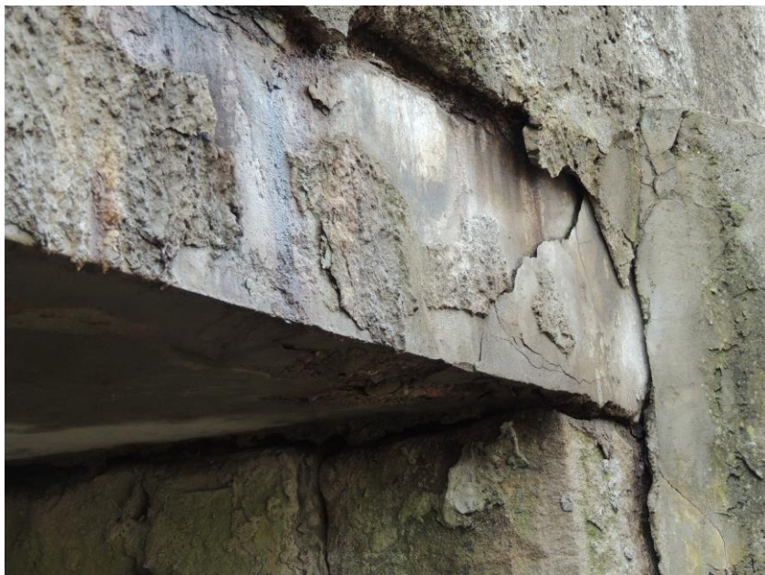
Odseparovaná hrana betonu nosné konstrukce vlivem korodující výztuže na vtokové části mostu nad pravou opěrou