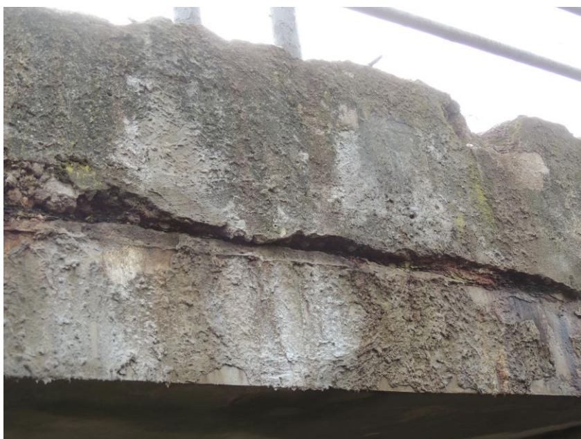
pohled na nosnou konstrukci nad vtokovou částí