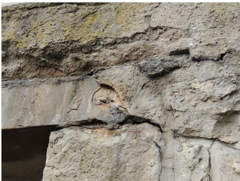
pohled na uložení nosné konstrukce na levou opěru – výtoková část