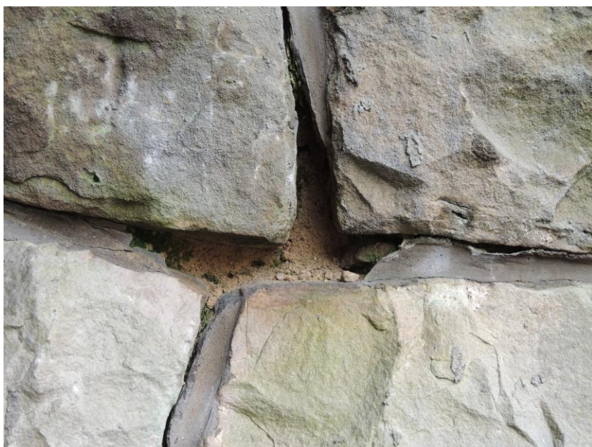
popraskaná a vydrolená styková malta na pravé opěře